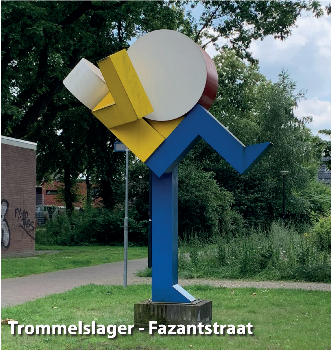
Trommelslager - Fazantstraat