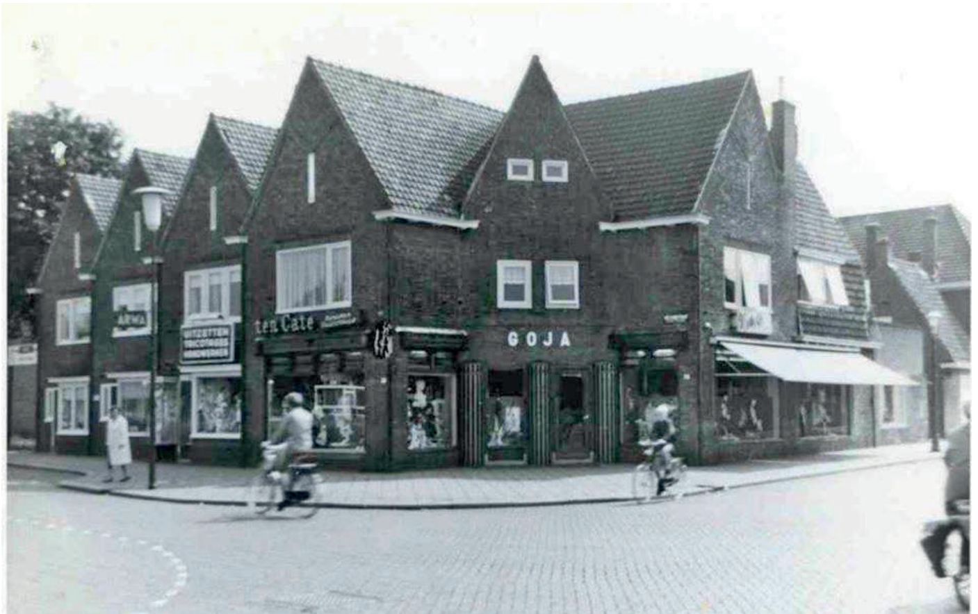
1967 - Heutinkstraat - Molukkenstraat - Zie ook pagina 17.